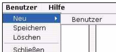
Abb. 4 Das Benutzer Menü

Das Benutzer Menü hat folgende Optionen (siehe Abb. 4):